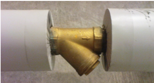
Billede af en ny snavssamler.

I grundejerforeningen er der husstande hvor der på varmerør er installeret snavssamler. Varmemester eller Ejerlaug er ikke bekendt med, hvor disse er installeret.